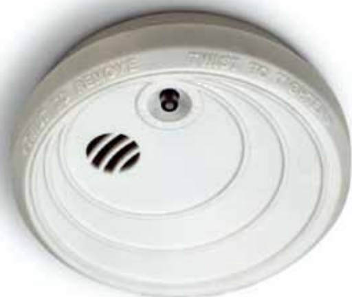
Det ska finnas minst en uppsatt och fungerande brandvarnare i varje lägenhet. Billigare liv- och egendomsförsäkring är svårt att hitta.

brandvarnare installeras, men att de boende sedan själva ansvarar för att regelbundet prova att den fungerar och byta batterier vid behov.